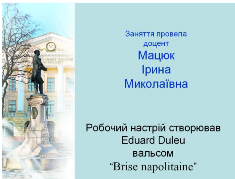
Рисунок 4 – Один из финальных кадров фильма «Построение планов скоростей»