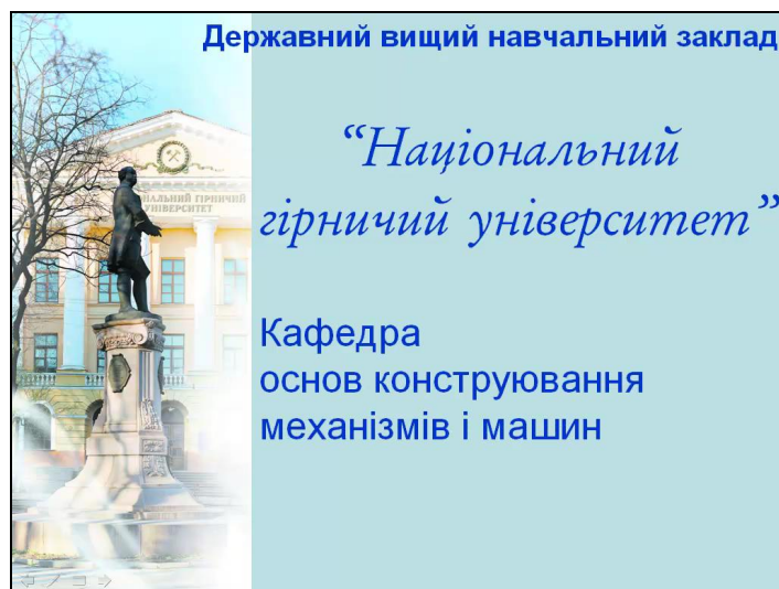
Рисунок 1 – Один из начальных кадров учебных видеоматериалов

На рис. 1-4 изображены кадры из учебных видеоматериалов. Ссылка для ознакомления с видеоматериалами находится в [1].