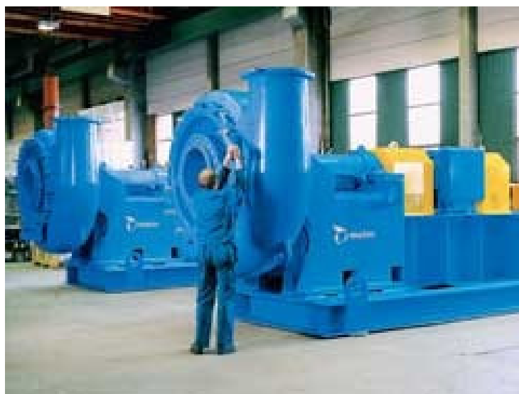
Рисунок 2 – Насос Metso Minerals в процессе сборки [1]

Основные меры повышения износостойкости узлов проточной части, примененные известными разработчиками, показаны в таблице 1.