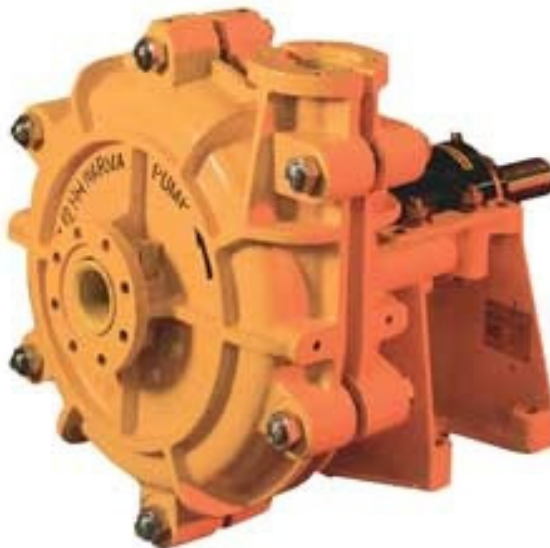
Рисунок 1 – Насос конструкции Warman серии AN для тяжелых условий эксплуатации [1]

Основные меры повышения износостойкости узлов проточной части, примененные известными разработчиками, показаны в таблице 1.