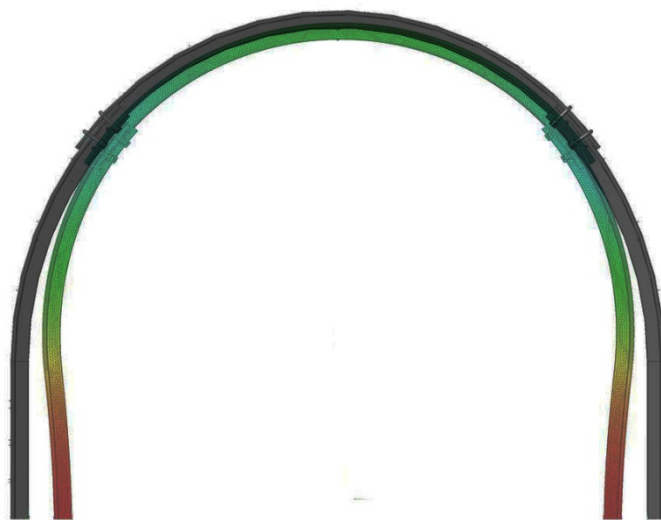
Рис. 1. Деформация крепи АП-27 под прилагаемым давлением

На рис.1 приведено визуальное сравнение исходной модели металлической арочной крепи АП-27 с той же крепью в результате ее нагружения.