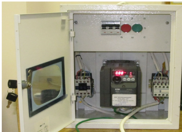
Рисунок 2 - Зовнішній вигляд щита керування електроприводом механізму підйому вантажу

Реалізація частотного керування електроприводом механізму підйому вантажу пов'язана зі зміною частоти напруги його живлення, яке виконується за допомогою частотного перетворювача та ПК. Зв'язок між частотним перетворювачем та ПК виконується за допомогою послідовного СОМ-порту [6]. З ПК на частотний перетворювач у певній послідовності відправляються керуючі сигнали, які призводять до зміни частоти напруги живлення двигуна і, як наслідок, до зміни швидкості його обертання. Організація розрахунку та посилки сигналів виконується за допомогою програми „Оптимальний підйом/опускання вантажу”, інтерфейс якої показано на рис. 3.