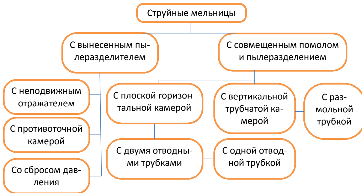
Рисунок 1- Классификация струйных мельниц

Принцип работы воздушноструйной мельницы заключается в следующем (рисунок 2). Воздух из атмосферы очищается с помощью масляного фильтра 2 при засасывании компрессором 3.