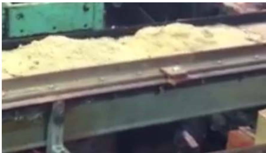
Рисунок 5 - Материал на вибротранспортёре сушильной установке волнообразной конфигурации, высота и ширина слоя по длине вибротранспортера значительно отличается, иногда принимая нулевые значения.