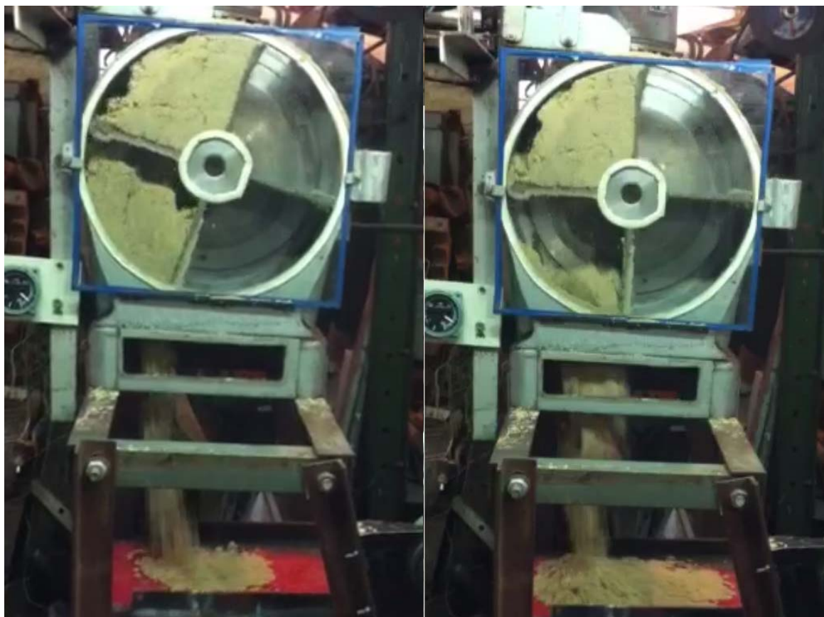
а) – начало разгрузки

ную ширину потока материала по мере разгрузки сектора питателя. В качестве примера на рисунке 4 приведено начало (рисунок 4а) и окончание разгрузки (рисунок 4б). Начальный момент разгрузки имеет минимальную ширину потока материала. По мере поворота барабана питателя сечение потока увеличивается, достигая максимальной величины к моменту окончания разгрузки.