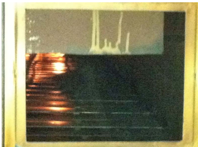
Рисунок 3 – Рабочая камера вибротранспортёра

Результатом этого является смещение материала по ширине вибротранспортёра (рисунок 3), появление свободных зон для выхода теплоносителя и резкое снижение эффективности сушки.