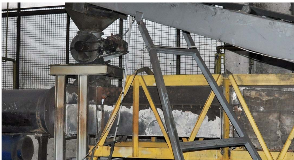
Рисунок 2 – Загрузочный узел опытно-промышленной установки

Общепринятая схема загрузки (рисунок 2) через шлюзовый питатель и переходное устройство в виде рукава из жаростойкой ткани приводит к неуправляемому поступлению материала в лоток вибротранспортёра