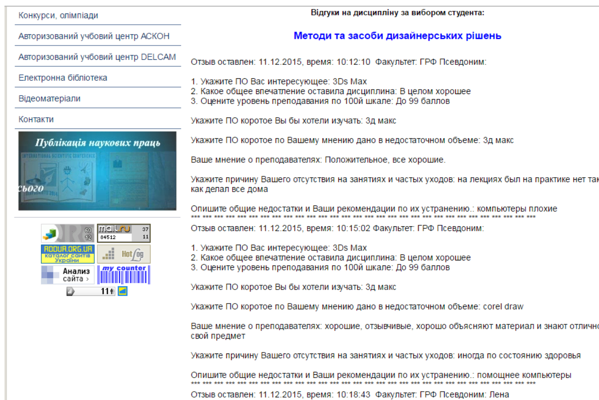
Рисунок 5 – Анкета-відгук студентів з вибіркової дисципліни «Методи та засоби дизайнерських рішень»

Так після закінчення вивчення кожної навчальної дисципліни студенти мають можливість оцінити як діяльність викладача, так і запропонований навчальний матеріал.