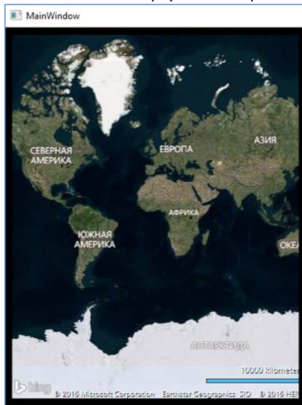
Рисунок 1 – Отображение карты в приложении WPF

Теперь нажимая клавиши "+" и "-" карту можно приблизить и отдалить.